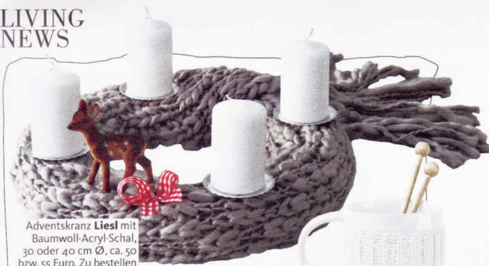
Adventskranz Liesl mit Baumwoll-Acryl-Schal, 30 oder 40 cm Ø, ca. 50 bzw. 55 Euro. Zu bestellen über werkstatt@vidu.de